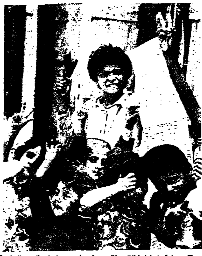
معرضة يحملها اطفال يطلبون موقوفها بتوزيع كيت الارز والسكر

اما بالنسبة لكمان وجود مورغان ، فان المعلومات الواردة الى القديين المعنية تشير الى ان محتجزه ، يتكلمون به من مكان الى اخر في احد احياء بيروت ، وعلى نطاق ضيق بسبب وجود الصوابز على القادد الرئيسية لهذا الصبي . وتضيف هذه المعلومات ان مورغان يتنقل داخل صندوق سيارة ، حتى لا يكتشف احد . وقد اضى ليلة في احد المداخل حيث شهود ليف كبر من الحراس يراقبون حول المكان . وفي الصباح اخفى الحراس ، وشرح بان مورغان نقل الى مكان اخر ، على بعد خمسة عشر تقريبا .